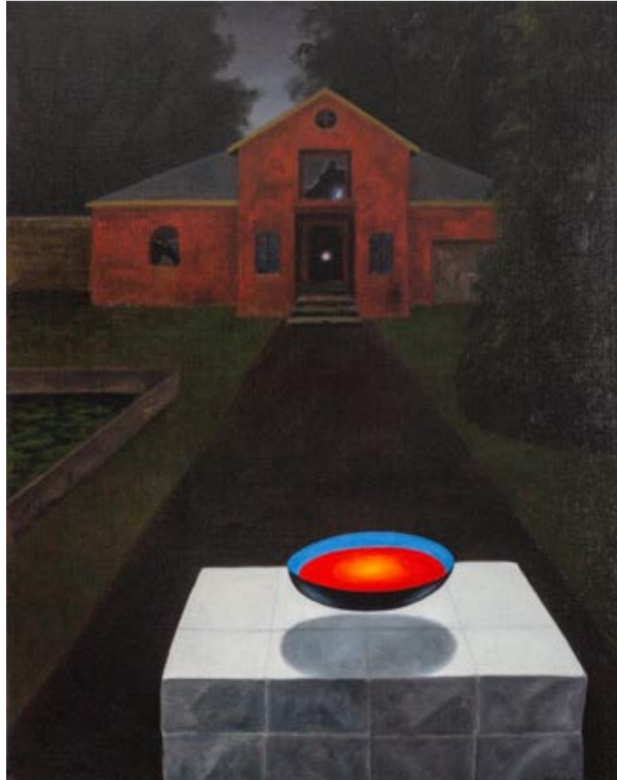
The Tower (Hommage á Giorgio de Chirico)