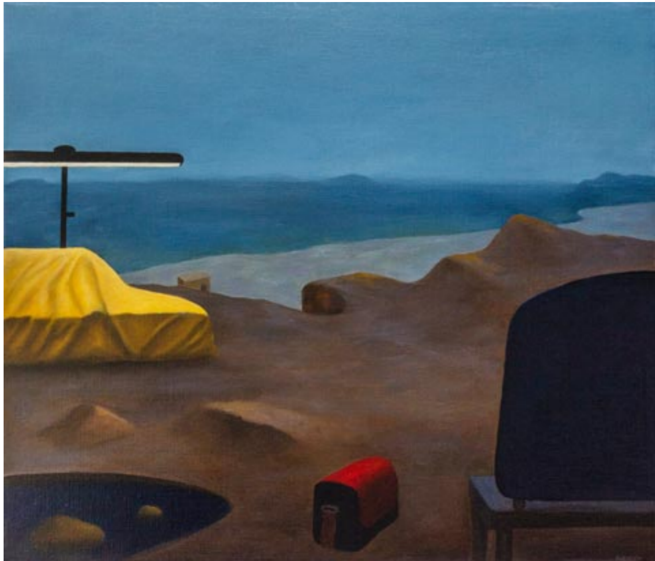
A Bench In The Park I (Hommage á Gunnar Ekelöf) | olie på lærred, 60x70 cm, Left panel, 2019