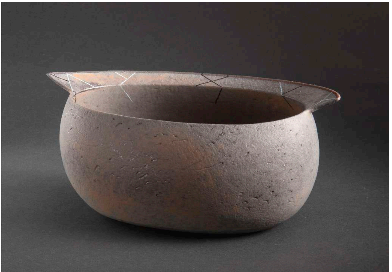
Malene Müllertz, "Keepsake" oval modeleret skål 2005 Stentøj 12x28x17 cm