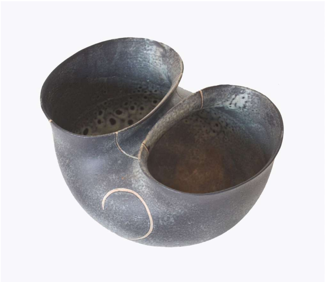
Malene Müllertz, "Dobbeltskål med spiral" 2002 Stentøj 16x27x20 cm