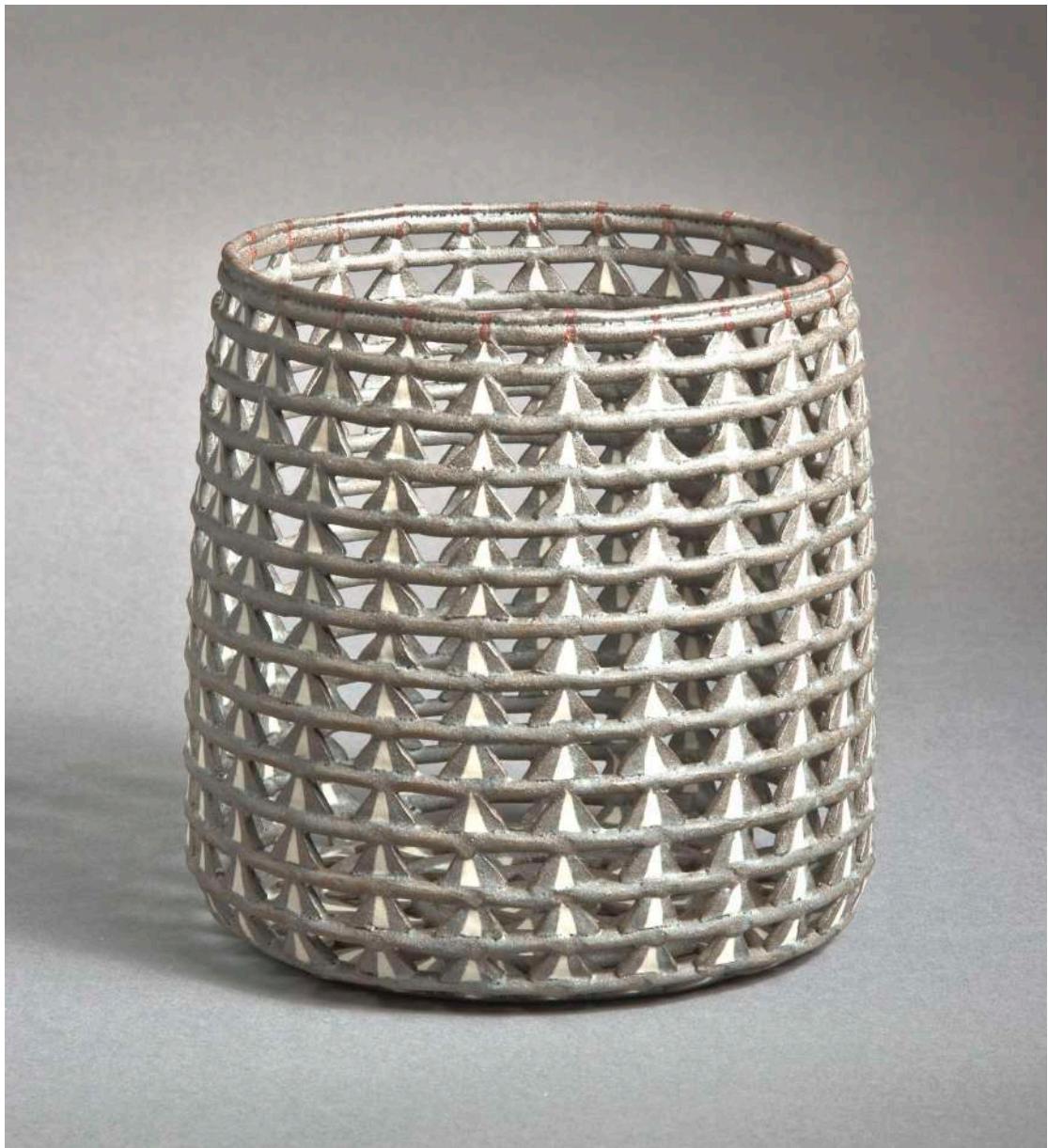
Malene Müllertz, "Intarsia Basket mørk" 2010 Stentøj 21x21x21 cm