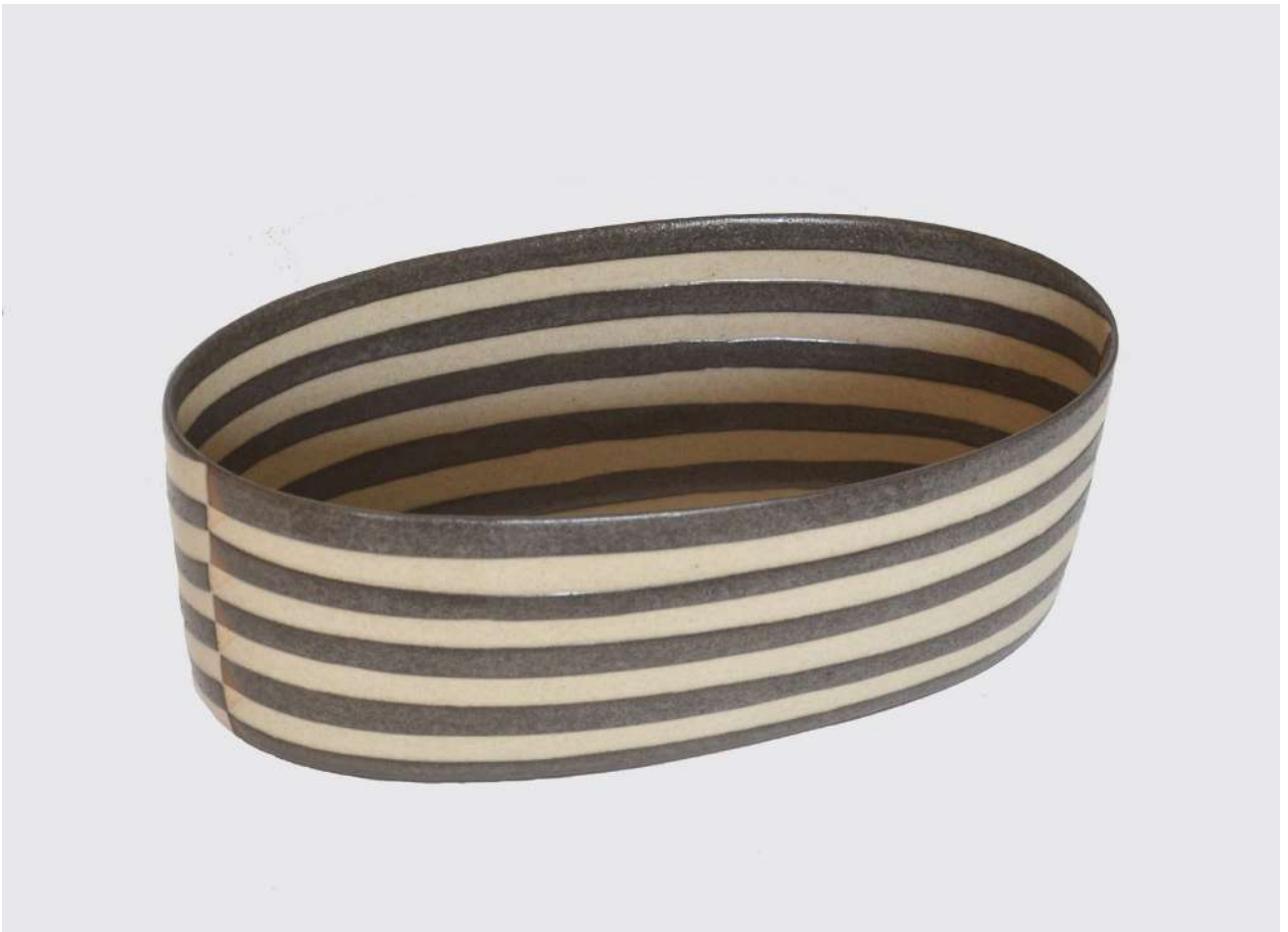
Malene Müllertz, "sort sribet oval skål" 1999 Stentøj, 14x42x23 cm