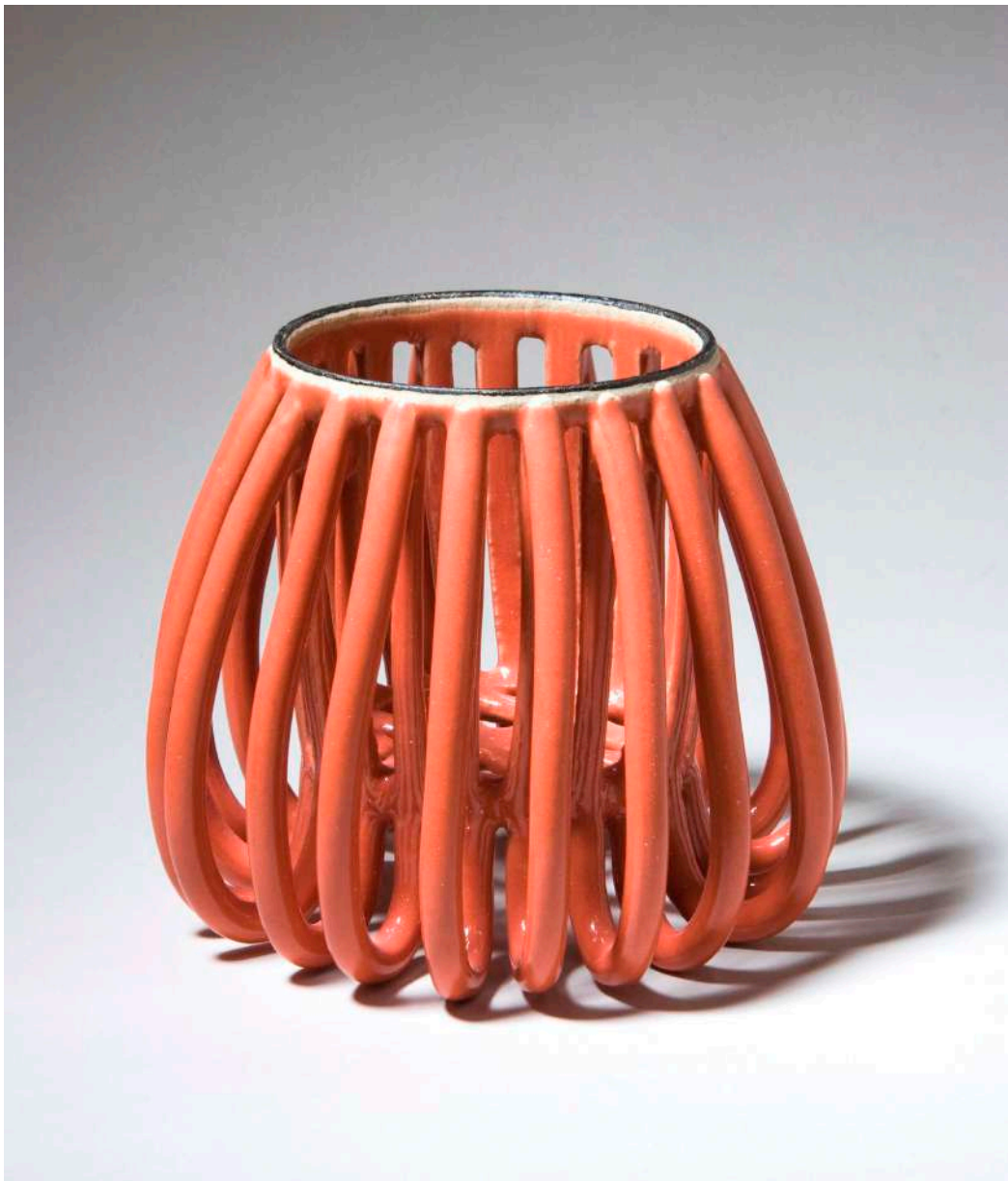
Malene Müllertz, "Rodnet lille rød" 2004 Stentøj 11x14x14 cm