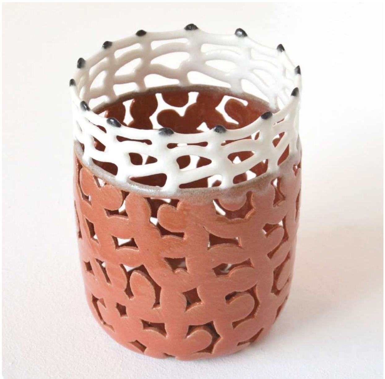
Malene Müllertz, "Lille koral net" 2021 Stentøj, 18x14x14 cm