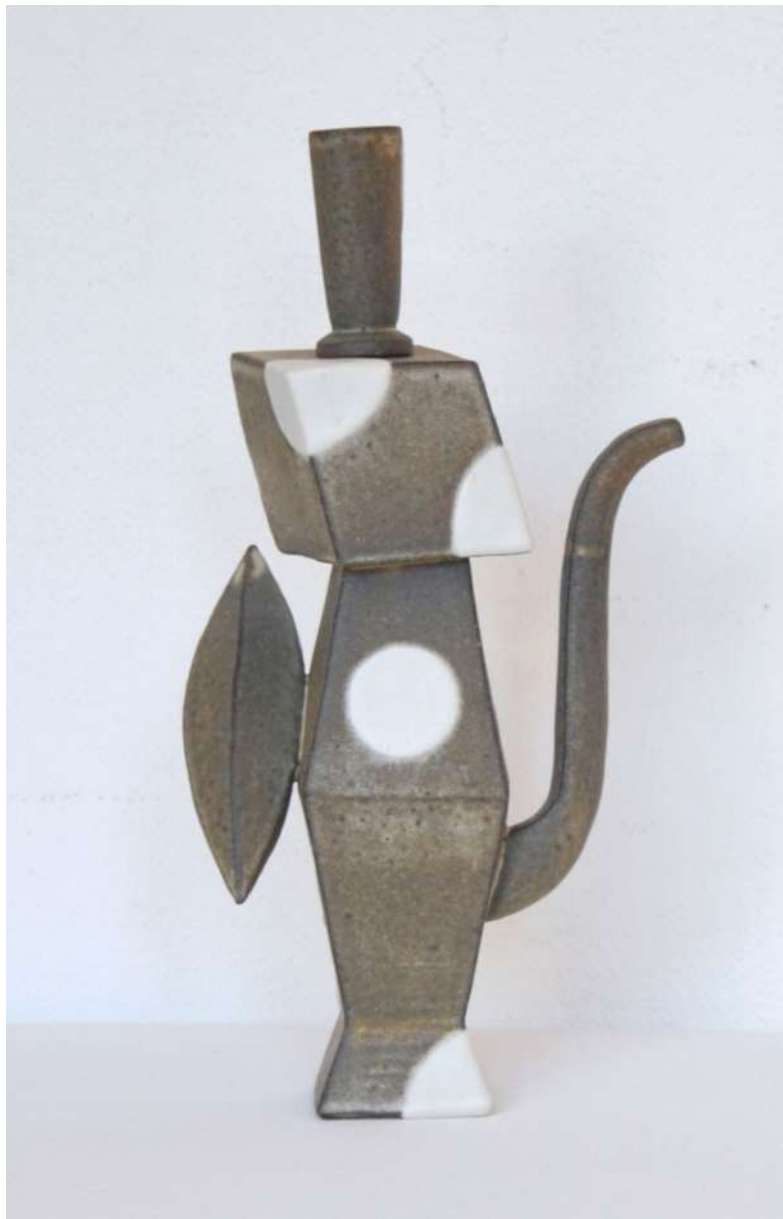
Malene Müllertz, "Grå kande med hvid plet" 2021 Stentøj 31x15x9 cm