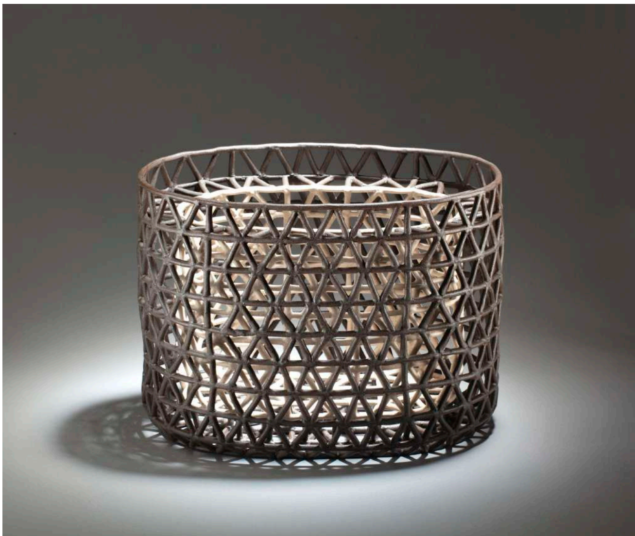
Malene Müllertz, "Zen, oval dobbelt basket" 2015 Stentøj 22x30x21 cm