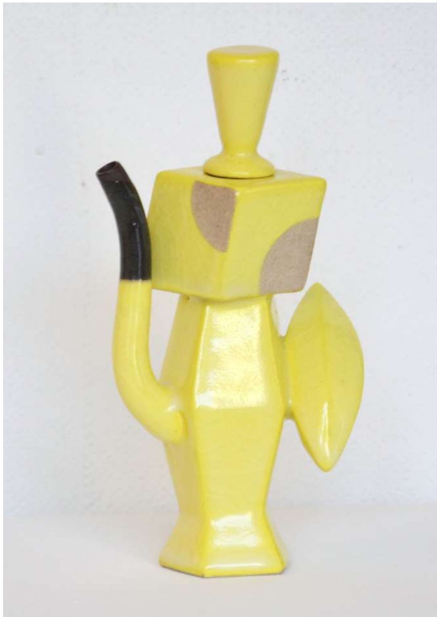
Malene Müllertz, "Gul kande med tounure" 2021 Stentøj 22x10x6 cm