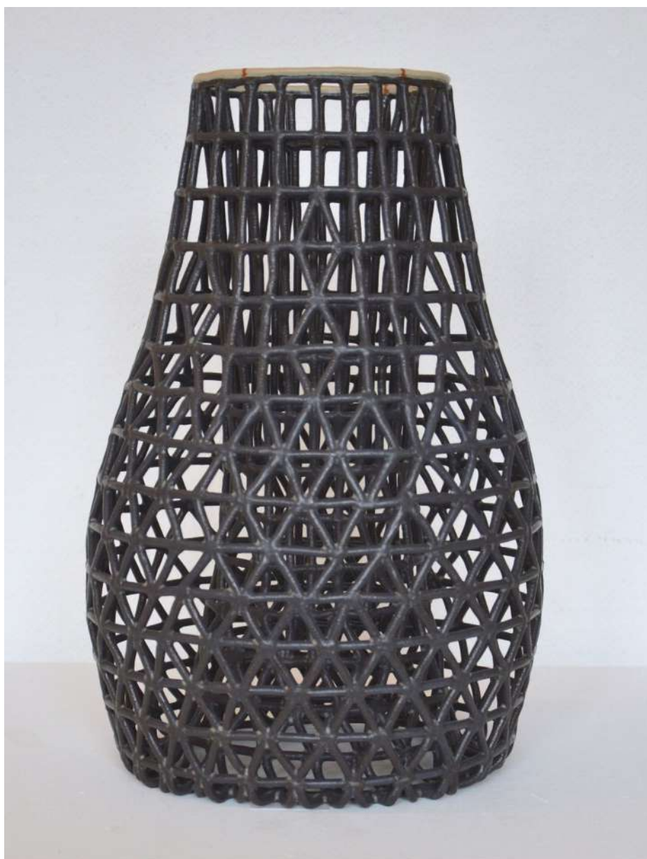
Malene Müllertz, "Sort syet ruse" Stentøj 34x22x16 cm