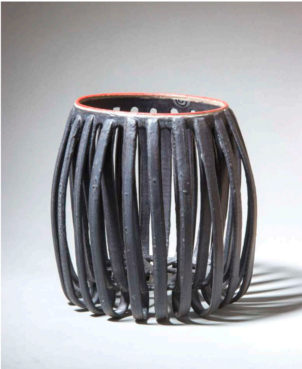
Malene Müllertz, "Rodnet sort md rød emalje" 2008 Stentøj 18x19x17 cm