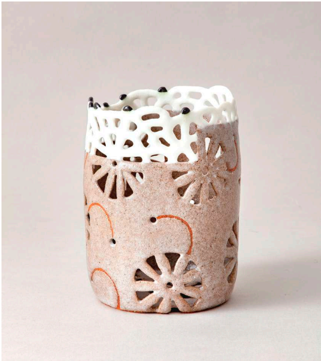
Malene Müllertz, "Magurite Tiara" 2021 Stentøj, 22,5x12x12 cm