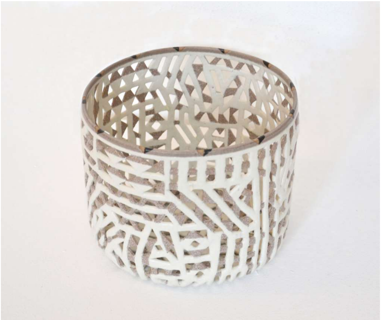
Malene Müllertz, "Andalusisk blondenet" 2011 Stentøj 18x22x22 cm