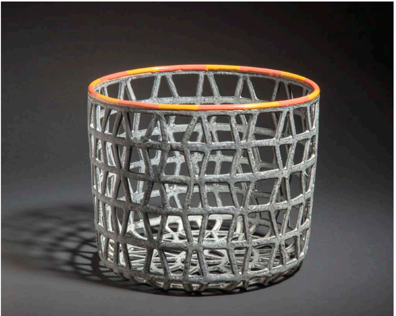
Malene Müllertz, "Net med orange kant" 2008 Stentøj 22x28x26 cm