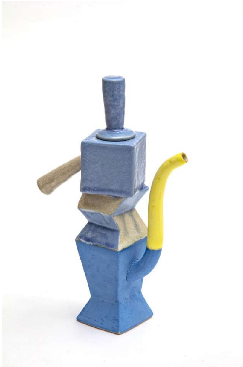
Malene Müllertz, "Blå kande med gul tud" 2021 Stentøj 12x24x 8 cm