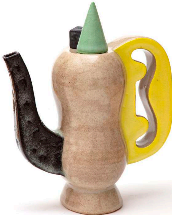
Malene Müllertz, "Kande med gult øre" 2021 Stentøj 24x20x10 cm